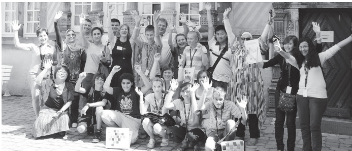
Fühlen sich ganz offensichtlich wohl: Die Teilnehmer des Paschkurses, hier im Innenhof des Schlosses Varenholz, kommen aus vielen Ländern, von Ägypten bis Pakistan.

Goethe-Institut organisiert dreiwöchige Freizeit im Privatschulinternat Varenholz